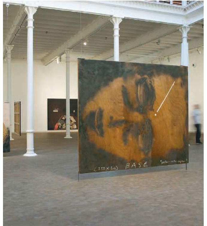
Antoni Tàpies. Cap braços cames cos

Les obres més recents condensen la brutalitat i la representació directa dels inicis, inscrites entre moviments d'apaivagament. Sense defugir la tensió entre el traçat i la matèria, la qual és inseparable en la pràctica, Antoni Tàpies construeix una obra que altera la mirada, però que també està obsedida per la materialitat ("la pastositat", com ell diu) del treball de pintor. La matèria és espessa, és carn, es pot gratar, foradar i obrir; s'abilla i es despulla.