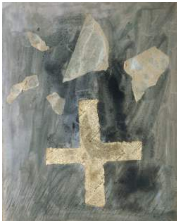
Antoni Tàpies. Creu de paper de diari, 1946-1947

L'àrea Arts combinatòries és una plataforma de treball col·lectiu i de relació amb els visitants, investigadors i col·laboradors de la Fundació que permetrà compartir, divulgar i actualitzar els continguts que el museu ha generat en l'exercici de les seves funcions i activitats des de la seva fundació. Arts combinatòries serà també un projecte de referència pel que fa al desenvolupament de plataformes digitals d'accés a continguts culturals a partir de processos de participació directa dels visitants.