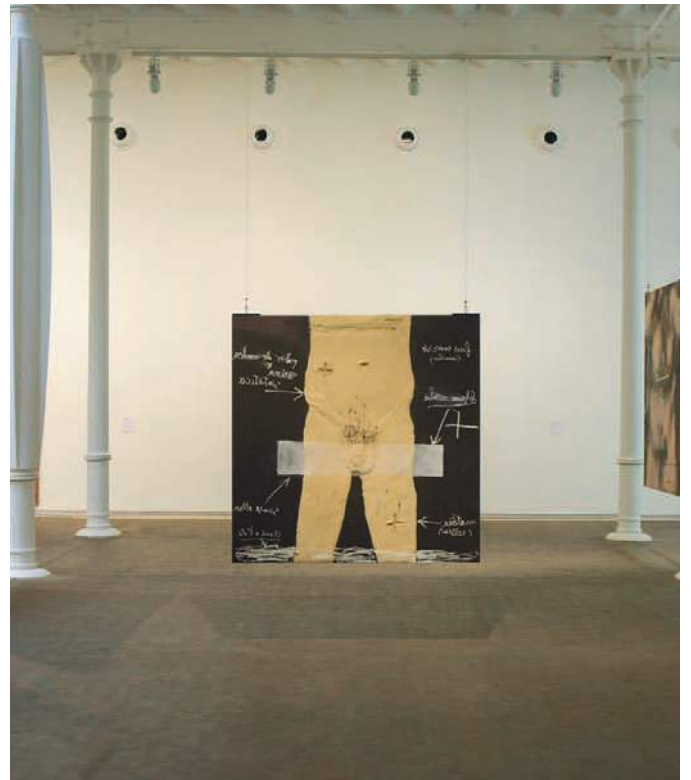
Antoni Tàpies. Cap braços comes cos

Antoni Tàpies i la seva obra es debaten amb la seva història, en un relat de la seva relació amb el món i amb el seu cos que recupera els turments de les qüestions fonamentals de l'ésser humà: la vida, la mort, la sexualitat.