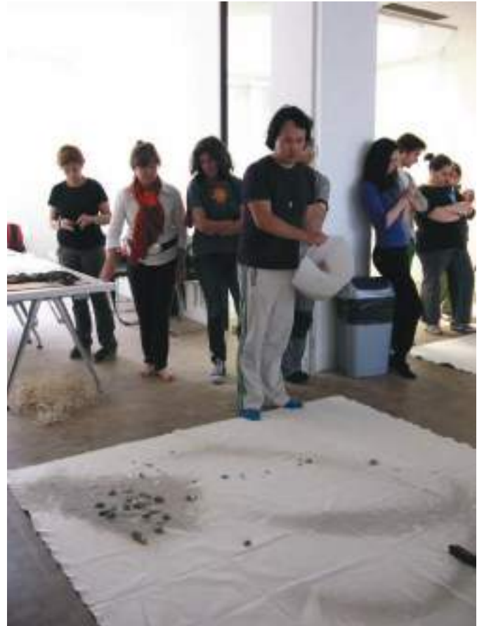
Activitat per a adults. Poesia d'aigua, tinta i sorra.