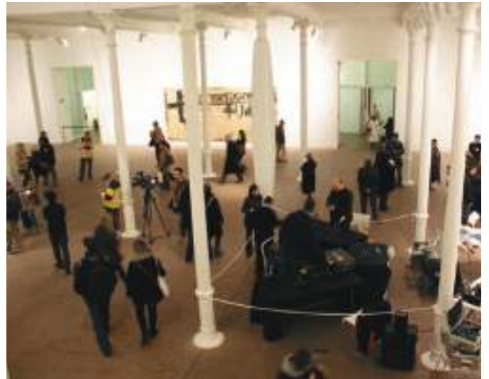
Visitants a l'homenatge a Antoni Tàpies

va rebre més de 27.000 visitants durant els mesos que va durar, i les diverses mostres d'obres de Tàpies del fons de la Col·lecció varen sumar més de 40.000 visitants.