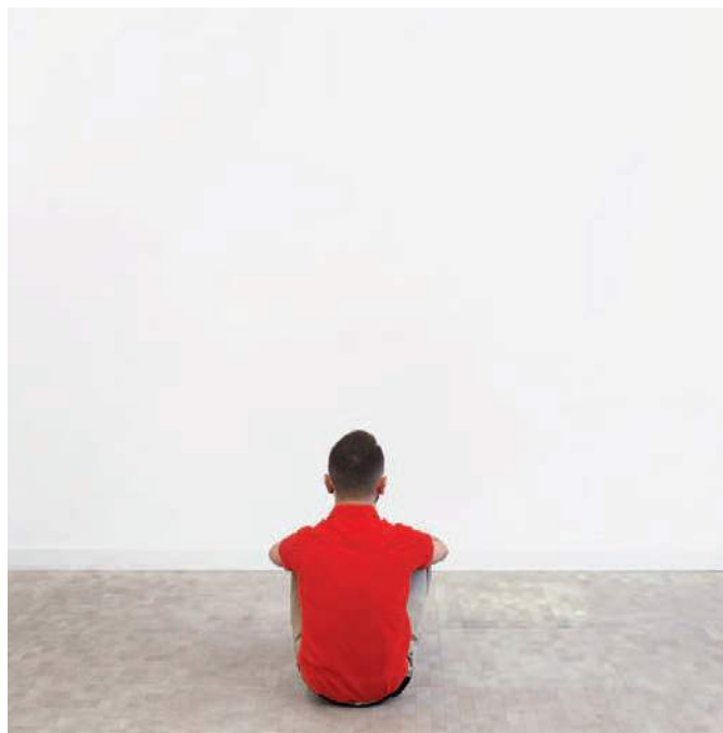
Retrospective. Xavier Le Roy

Comissariada per Bettina Knaup i Beatrice Ellen Stammer, The Performing Archive és una exposició internacional itinerant i un projecte arxivístic que recorrerà Europa des del 2011 fins el 2013. Compta com a base amb un arxiu cada vegada més ampli que conté aproximadament 200 obres d'art de performance i de crítica política de les dècades de 1960 i 1970, així com una selecció d'obres contemporànies que es presentarà en set ciutats europees.