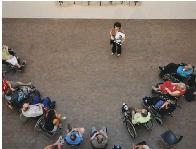
Grup de gent gran a la Fundació

Cafè i paraules, visita comentada seguida d'una tertúlia participativa, va ser l'activitat adreçada a gent gran proposada durant el 2012. La participació en les dues dates proposades va ser molt escassa, fet que va comportar la reflexió de la necessitat de reforçar la difusió i l'elaboració d'un programa específic adreçat a col·lectius tals com a casals d'avis, residències, etc. En aquest sentit es va portar a terme com a experiència pilot una presentació de l'activitat adreçada als responsables d'aquest tipus de centres que va tenir molt bona acollida i que va marcar el camí a seguir: una difusió específica i personalitzada. La concertació de visites específiques amb grups organitzats va comportar la realització de l'activitat Cafè i paraules per 120 persones majors de 60 anys.