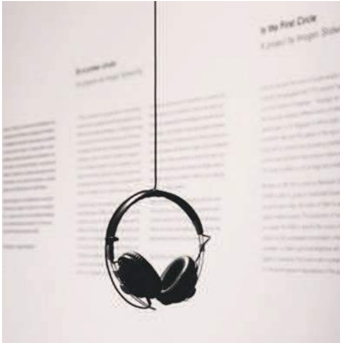
Els límits del llenguatge