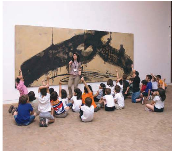
Esudiants de primària a la Fundació

El programa d'activitats adreçades al públic escolar es va difondre mitjançant l'enviament d'un fulletó a totes les escoles de la província de Barcelona i també a partir de la participació en la Presentació del Programa d'Activitats Escolars (PAE) que va organitzar el Consell de Coordinació Pedagògica de l'Ajuntament de Barcelona el 2 de juliol de 2012 a Cosmocaixa.