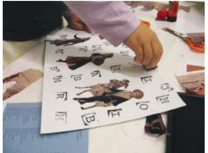
Joc de la néta de Francesc Simon

Aquesta lectura es va programar de nou al desembre de 2012. La participació a les dues lectures va ser de: 118 persones.