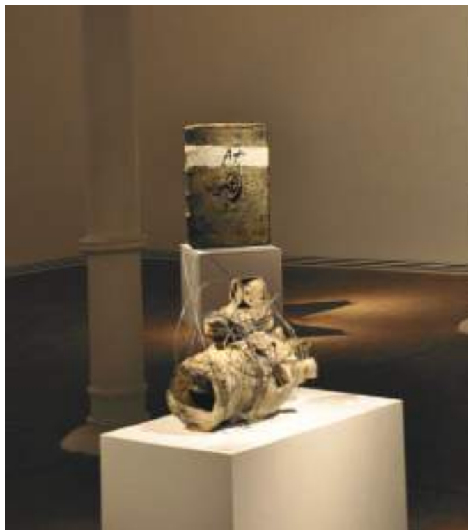
Col·lecció 3 Col·lecció 4