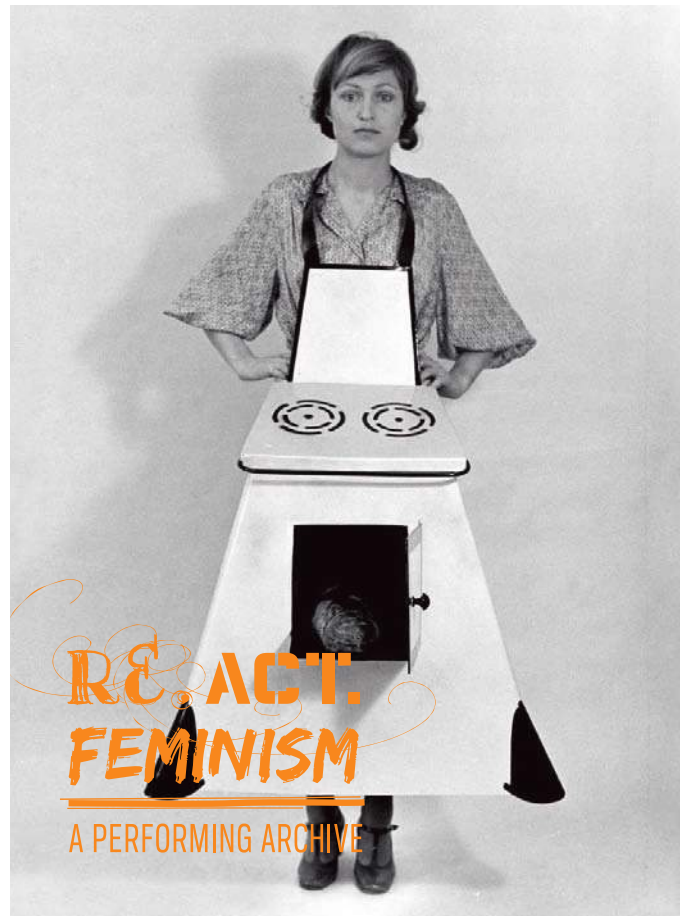
Re.act.feminism # 2. A Performing Archive

Aquest projecte aplega obres de l'Europa de l'Est i de l'Europa Occidental, de la zona del Mediterrani i del Pròxim Orient, dels Estats Units i de l'Amèrica Llatina, i ofereix visions artístiques a través del temps i de la geografia amb l'objectiu d'enfortir el diàleg entre generacions i cultures. En gira a través d'Europa, aquest arxiu temporal s'amplia contínuament gràcies a la recerca local i a la col·laboració amb acadèmies d'art i universitats, i va acompanyat de tallers, performances i xerrades.