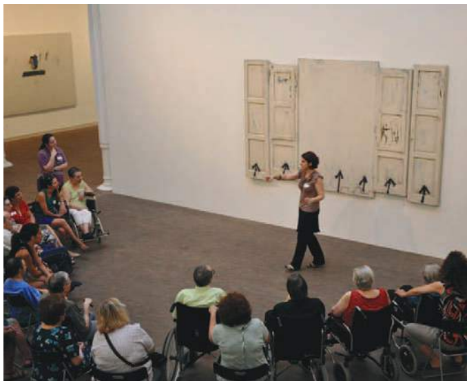
Grup de persones amb discapacitat a la Fundació

El servei educatiu es va reunir al llarg de 2012 amb diferents empreses i associacions que treballen per la integració de persones amb discapacitat o en risc d'exclusió social. L'objectiu va ser l'inici d'accions específiques que més enllà de l'atenció puntual a demandes específiques contempli la inclusió al museu de tots els seus visitants potencials.