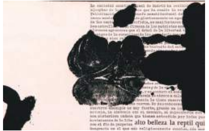
Fotografia d'un detall de les pàgines 24 i 25 del llibre d'artista d'Antoni Tàpies 'Anular' (1981). Detall núm. 24.

Actualment aquest llibres es poden consultar a la plataforma web d'Arts combinatòries ( http://www.fundaciotapies-ac.org/ )