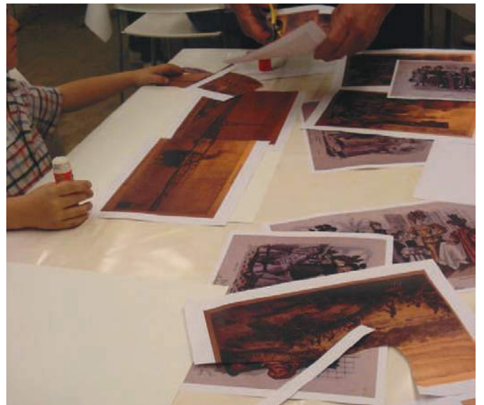
La nit dels museus

Durant les vacances escolars de Nadal es va programar l'activitat Rastres de pluja, marques de foc que de manera excepcional es va adreçar únicament als nens. Van assistir 17 nens i nenes de 6 a 12 anys